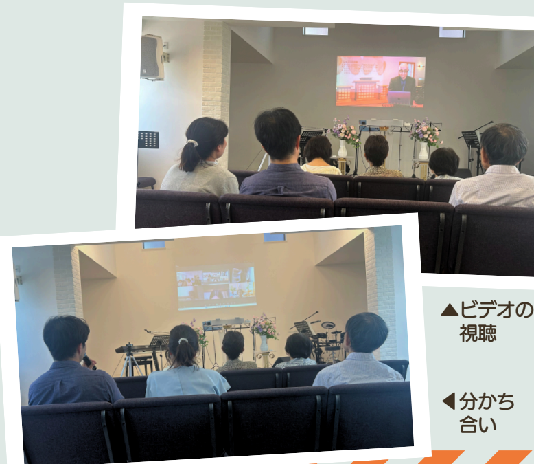
▲ビデオの視聴 ◀分かち合い

学んでいる教会員のコメントをご紹介します。バイブルアカデミーで学び、神様が自分で思っていた以上にとても偉大なお方であることを強く思われています。人間が神様をまだ知らない時にも、神様はご計画に仕掛けて備えておられるお方であること、救いに与ったのも神様の深いご慈愛によるものだとしてこれまで以上に思われ感謝しています。この神様の思いを受け取り、神様をまだ知らない人たちに伝道していきたいと思えます。そして聖霊様に明け渡すということをもっと理解するために、聖書を学びディボーションを大切にしていきたいです。